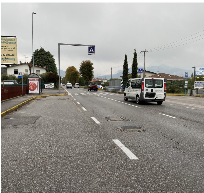
Raffa di Puegnago SP BS 572 VIA NAZIONALE Fermata con diverse intersezioni un un tratto di rettilineo.