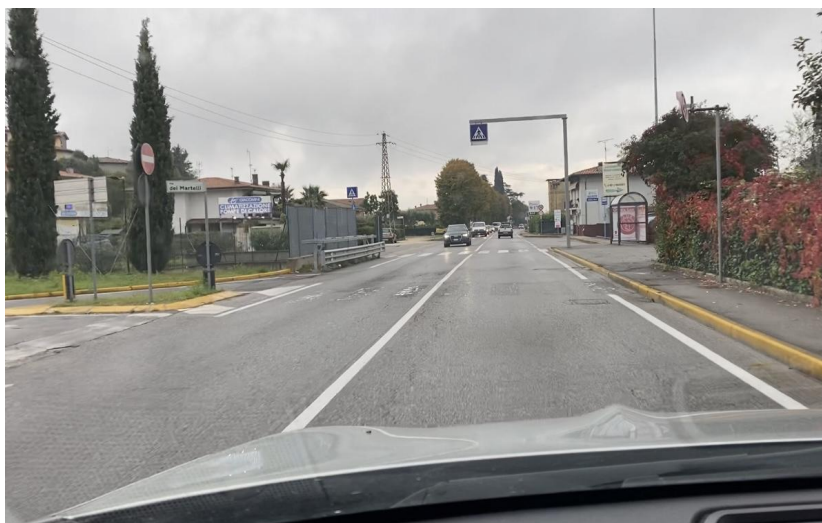
Raffa di Puegnago SP BS 572 VIA NAZIONALE Fermata con diverse intersezioni in un tratto di rettilineo.

Chiediamo che venga messo lo spartitraffico all'altezza delle strisce pedonali, per la sicurezza dei pedoni che attraversano in questa fermata che vedete dalle fotografie.